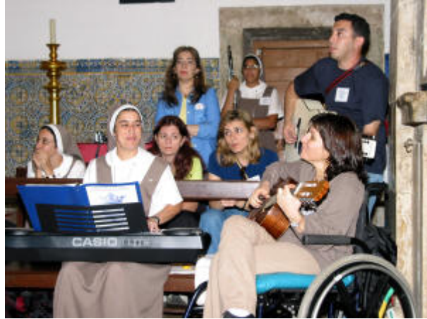
Peregrinación de 2002