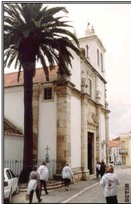
Exterior de la Iglesia del Milagro Eucarístico de Santarem