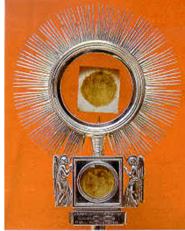
Visto de cerca