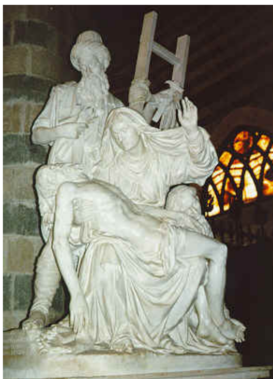
Arte Mariana en la Catedral de Orvieto