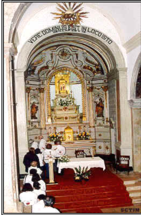
Peregrinos esperan para venerar a Jesús de cerca. El milagro aparece expuesto arriba.