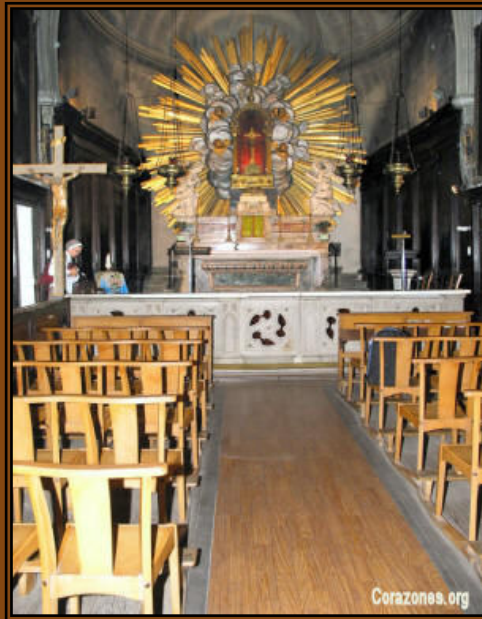
se parten dejando seco y seguro el tabernáculo Derecha: Los peregrinos adoramos la Eucaristía en 1999 en el mismo lugar del milagro que ocurrió en 1443.